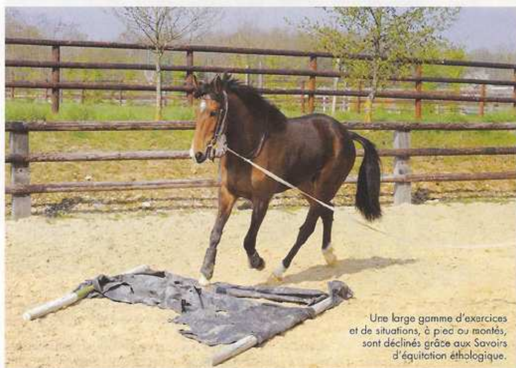
Une large gamme d'exercices et de situations, à pied ou montés, sont déclinés grâce aux Savoirs d'équitation éthologique.

De même, le travail à pied, avec et sans "embûches", peut se décliner à l'infini et satisfaire en soi